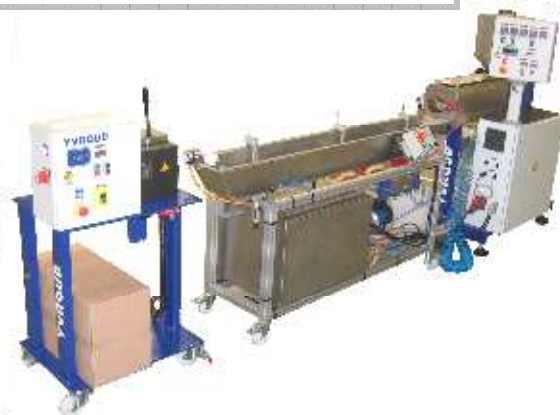
Ligne de granulation / secteur laboratoire- R&D Pelletizing line / R&D application