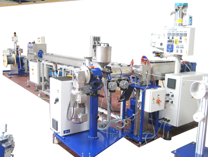
Ligne de granulation / secteur laboratoire- R&D Pelletizing line / R&D application