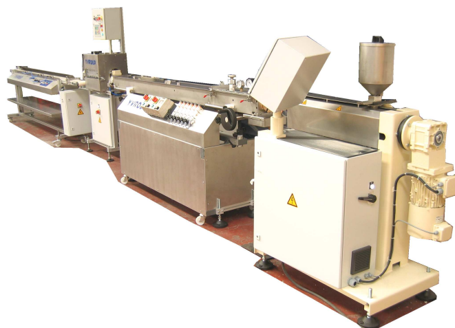
Ligne de revêtement tube de cuivre / secteur géothermie Copper pipe coating line / geothermal application