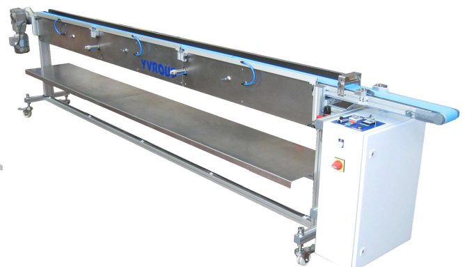
Tireur de gaine