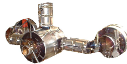
Coupe en ligne haute cadence Enrouleurs automatiques