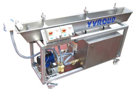
Bac de granulation 2 m type BAG2000 avec sécheur à turbine et circuit fermé