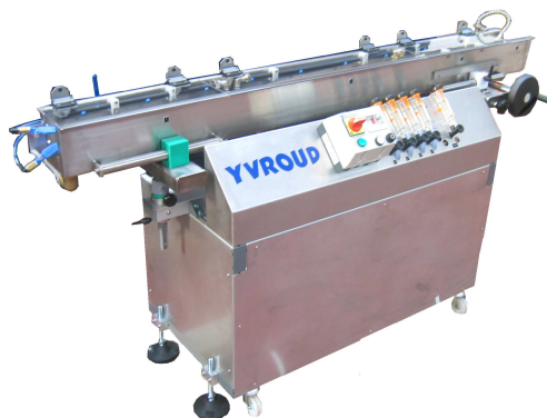
Bac de pulvérisation 3 m type BAP 3000 option réglage 3 plans et circuit fermé