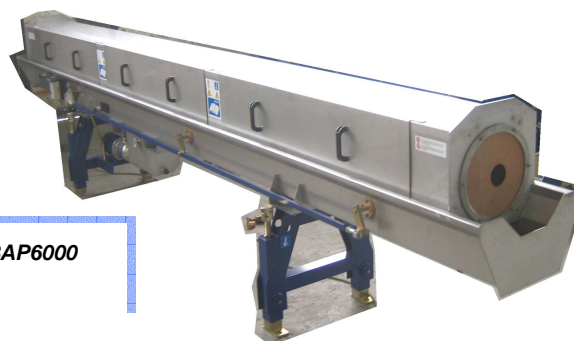
Bac de pulvérisation 6 m type BAP6000 Pour tubes Ø 200