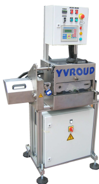
Conditionneuses et Machines spéciales